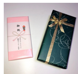
Mさん 商品券・クッキー

きく成長していることをとても嬉しく思うとともに、人生に真剣に向き合う姿に多くを学ばせていただきました。