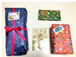
商品券・チョコレート・スリッパ

子ども達を日々お世話してくださる保護者の方へ、足元暖かく過ごしていただくとうと羊毛スリッパと日本製のレッグウォーマーを同梱させていただきました。