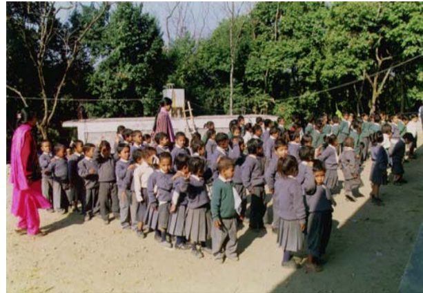
上 (1998年の生徒) 下 (2002年の生徒)