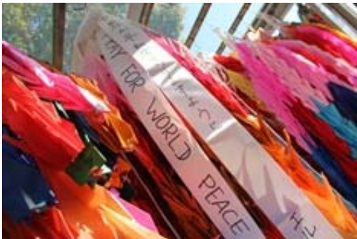
世界が平和でありますように

そんな子ども達のたくさんの気持ちのこもった千羽鶴を平成26年1月29日広島の6人で「平和公園の原爆の像」横の折り鶴置き場に納めました。