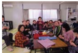
仮設の集会所にて

しく思いま した。 今後も現 地の方のご 要望に添っ て支援を続 けたいと思 います。